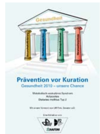
Abb. 2 ▲ Namhafte Experten stellen im DDS-Faktenbuch „Prävention vor Kuration – Gesundheit 2010 – unsere Chance“ die wesentlichen Faktoren einer erfolgreichen und zielgerichteten Präventionsarbeit vor.