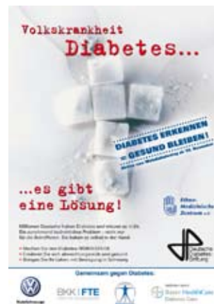
Abb. 1 ▲ Zum diesjährigen Welttag der Diabetes fand eine Diabetes-Screening und -Aufklärungsaktion bei der Volkswagen AG in Hannover statt.

Über 7 Millionen Diabetiker in Behandlung, Dunkelziffer in Millionenhöhe, Therapiekosten aktuell p.a. etwa 25 Mrd. Euro. Mit der kürzlich vorgestellten Fakten-Broschüre „Prävention vor Kuration“ (ISBN 978-3-87490-811-5) wird aufgezeigt, dass diese gesamtgesellschaftliche Aufgabe die einzige wirkliche Chance ist, unser System vor einem volkswirtschaftlichen Desaster zu bewahren. Auf Basis einer Präventionsstrategie und mit Hilfe von Präventionsmanagern soll ab 2010 eine flächendeckende Vorsorge für Risikopersonen möglich sein. Mittels einfacher Früherkennung (FINDRISK- oder GDRS-Risikocheck) und motivierender Betreuung durch Präventionsmanager sollen adipöse Prädiabetiker durch einfache Lebensstil-Interventions-Programme möglichst lange nachhaltig vor Diabetes Typ 2 bewahrt werden (Abb. 2).