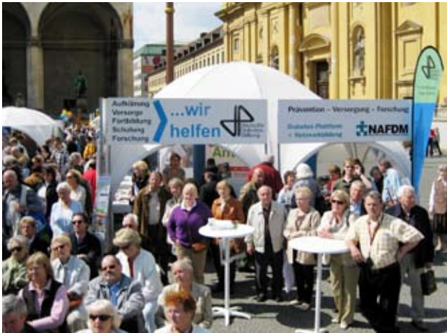
Abb. 4 ▲ 20.000 Besucher konnte der 17. DiabetesMARKT der DDS auf dem Münchner Odeonsplatz verzeichnen und damit ein Rekordergebnis verbuchen.

Weitere Informationen auf den Internetseiten: www.diabetesstiftung.org www.diabetesstiftung.de