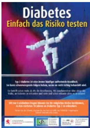
Abb. 3 ▲ Der ursprünglich in Finnland entwickelte und mit Mitteln der DDS evaluierte FINDRISK-Fragebogen kommt häufig zum Einsatz. Hier ein Beispiel aus Luxemburg.

Mit Experten-Workshops, Netzwerk-Bildung, Aufbau des Koordinierungszentrums und Schaffung wie auch Evaluierung von Einsatzmitteln und Einrichtungen, versucht die DDS mit ihren Partnern (allen voran dem NAFDM) und Kostenträgern die Voraussetzungen für mach- und bezahlbare Prävention zu schaffen. Es gibt viel Interesse an diesem lernenden System und die Zahl der Kooperationspartner wächst ständig. Besonders bemerkenswert ist das von P. Schwarz, Dresden, rekrutierte und koordinierte EU-Projekt IMAGE , das parallel auf europäischer Ebene ein Präventions-Szenario erarbeitet – in Kooperation mit der DDS.